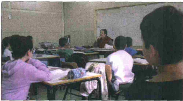
כיתה כבדי שמיעה בכיה"ס היסודי רבין שהותאמה במיוחד לתלמידים בעלי לקויות שמיעה.

בישראל יש כעשרת אלפים ילדים עם לקויות שמיעה בדר-גות חומרה משתנות. רובם לומ-דים בכתי"ס וגנים רגילים וזק-רים להתאמת הסביבה הלימור-דית לצורכיהם. בכיתה המותא-מת לכבדי שמיעה מתקנים יזוג כפול בחלונות, שטיחים